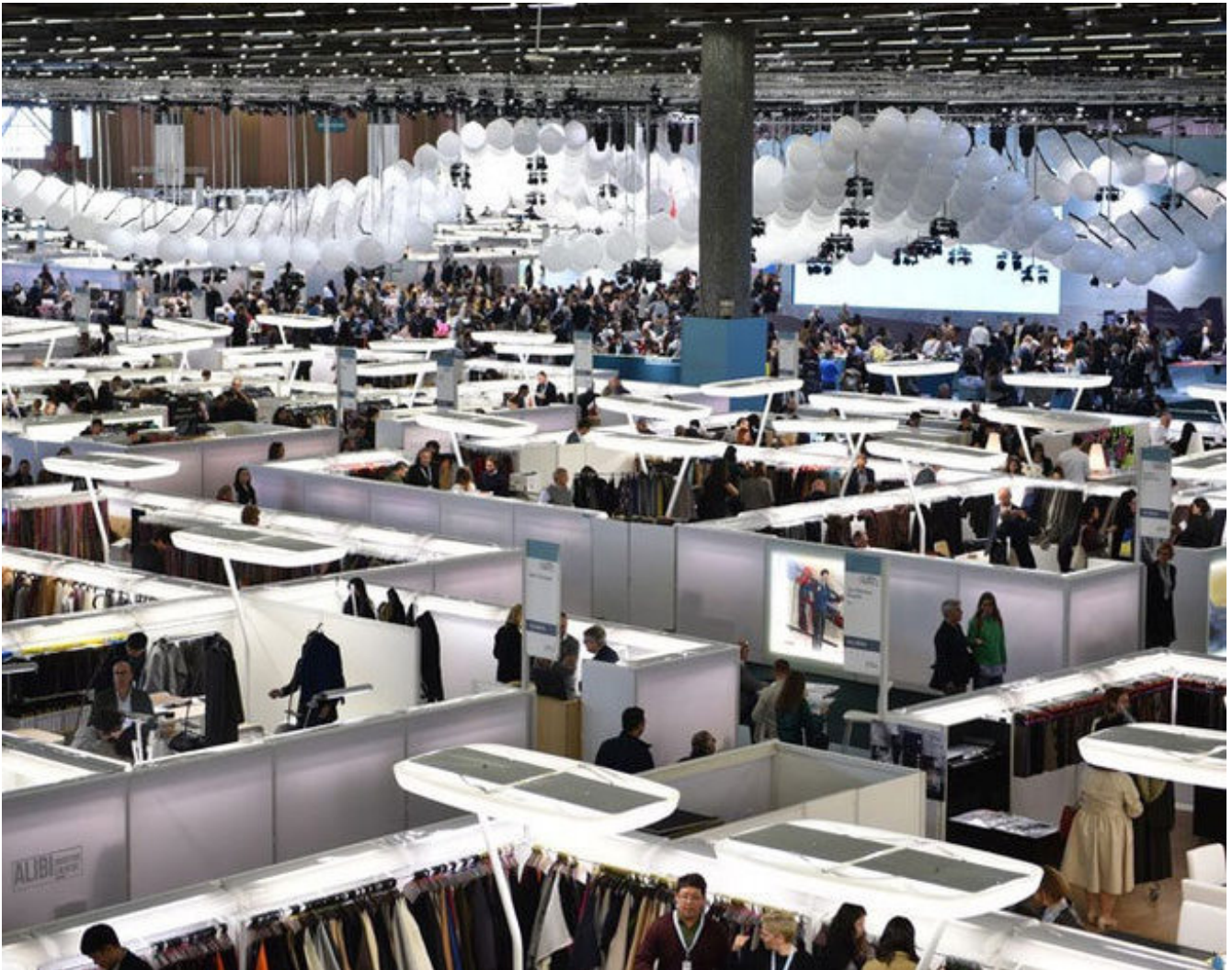
Le salon a accueilli 56 250 visiteurs sur son édition de février 2017 - Première Vision Paris

El salón del sector textil de la moda, Première Vision Paris, tendrá lugar del próximo 13 al 15 de febrero en el parque de exposiciones de la capital francesa, donde reunirá cerca de 1725 sociedades del mundo entero. La oferta, un 1,6% mayor con 113 nuevos expositores, irá acompañada de novedades.